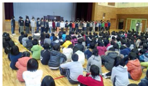
5年生の「お礼の歌」合唱

地震にも 負けない 強い心を持って 亡くなった方々の分も 毎日を 大切に 生きてゆこう 傷ついた「ふるさと」を もとの姿にもどそう 支えあう心と 明日への 希望を胸に 響きわたれ ほくたちの歌 生まれ変わる 「ふるさと」のまちに 届けたい わたしたちの歌 しあわせ 運べるように