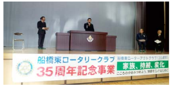
子供たちに激励の言葉を贈る大原会員