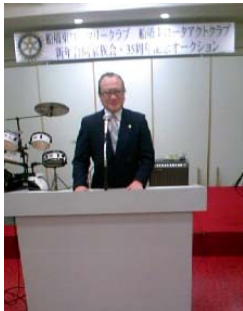
移動例会 会長挨拶